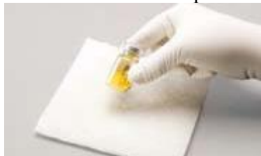
Figura A: Agitați ferm pentru amestecare