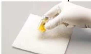
Figura A: Agitați ferm pentru amestecare