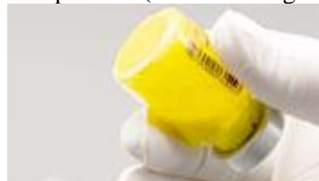
Reconstituire completă: fără particule vizibile

Figura B: Se va verifica pentru existența pulberii neînglobate în suspensie și se va agita din nou dacă este cazul