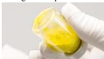
Reconstituire incompletă: particule vizibile