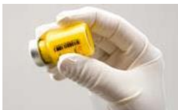
Figura C: Se agită ferm flaconul

Dacă se formează spumă, flaconul se lasă să stea pentru a permite disiparea spumei. Dacă medicamentul nu este utilizat imediat, se va agita puternic pentru refacerea suspensiei. Suspensia reconstituită de ZYPADHERA rămâne stabilă în flacon timp de până la 24 ore.