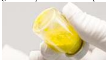
Reconstituire incompletă: particule vizibile