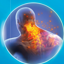
Zona cervicală și umeri