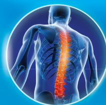
Zona lombară și toracică