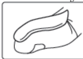
O unitate de vârf de deget